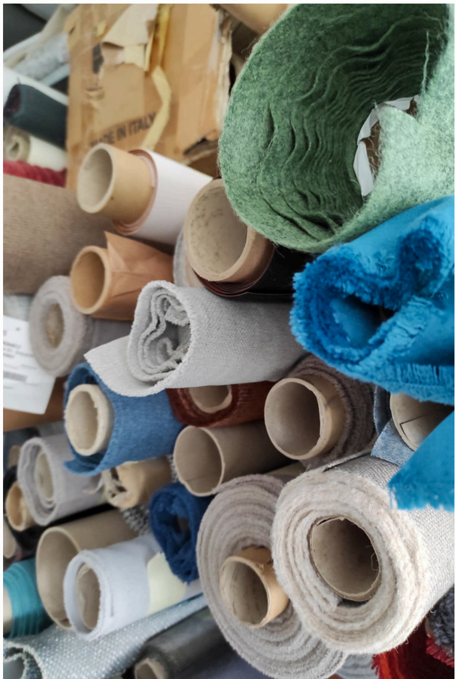
// Reparto taglio e cucito